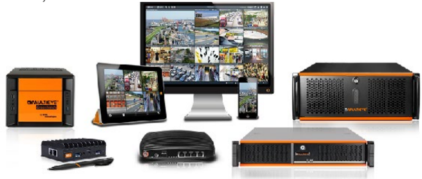
MULTIEYE Produkte für Videoüberwachung